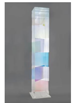
Iris, 2004, Acrylglas, Farbeffektglas 233 x 39,5 x 39,5 cm.

Seit Jahrzehnten arbeitet unsere Galerie intensiv mit dem Mitbegründer der international berühmten ZERO-Gruppe, Heinz Mack, zusammen. Der Künstler prägte durch sein vielseitiges Oeuvre entscheidend die Kunstgeschichte der Nachkriegszeit. Entdecken Sie in der Ausstellung eine Zusammenstellung neuester Werke des Künstlers. Gezeigt werden Leinwand- und Papierarbeiten sowie Skulpturen, beispielsweise die facettenreiche Acrylglasstele Iris, 2004, 233 x 39,5 x 39,5 cm.