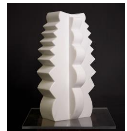
Regina Candidus, 2020, Marmor (Lasa, Italien), 53 x 27 x 24 cm

Neben den dynamischen Farbkompositionen auf Leinwand und Papier zeugt die weite Bandbreite an gezeigten Skulpturen in dieser Werkschau, von dem souveränen Umgang des Künstlers mit Material und Form. Skulpturen wie Regina Candidus, 2020, 53 x 27 x 24 cm, gearbeitet aus fein poliertem Lasa Marmor, spiegeln dabei Heinz Macks virtuose Bildhauerei.